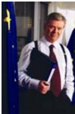
David Byrne Europese Commissaris voor Gezondheid en Consumentenbescherming