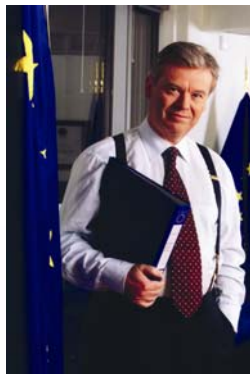
David Byrne Comisario Europeo para la Salud y Protección al Consumidor